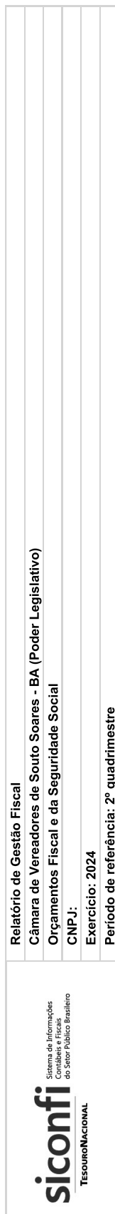
RGF-Anexo 01 | Tabela 1.2 - Trajetória de Retorno ao Limite da Despesa Total com Pessoal