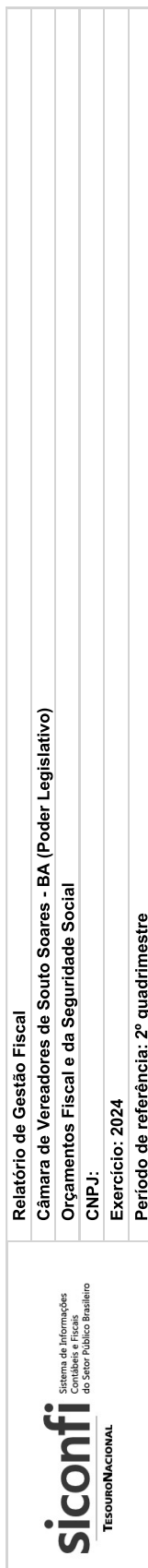
RGF-Anexo 01 | Tabela 1.2 - Trajetória de Retorno ao Limite da Despesa Total com Pessoal